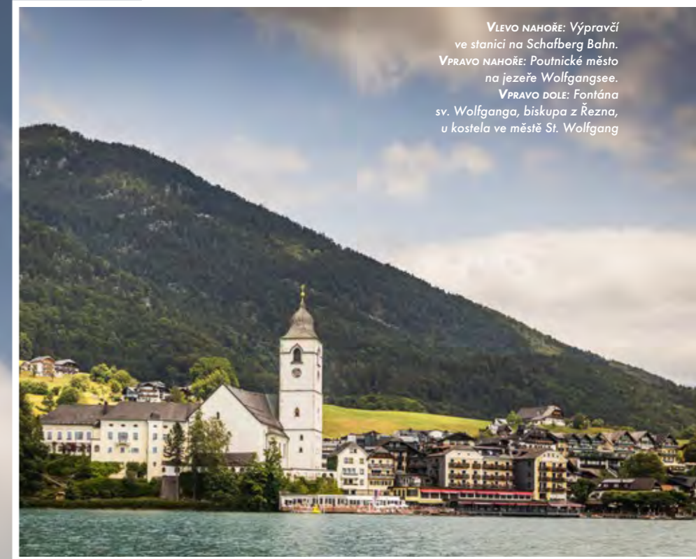
VLEVO NAHOŘE: Výpravčí ve stanici na Schafberg Bahn. VPRAVO NAHOŘE: Poutnické město na jezeře Wolfgangsee. VPRAVO DOLE: Fontána sv. Wolfganga, biskupa z Řezna, u kostela ve městě St. Wolfgang

Pohled z motorového člunu na skalní útesy u nehlubšího bodu jezera Wolfgangsee