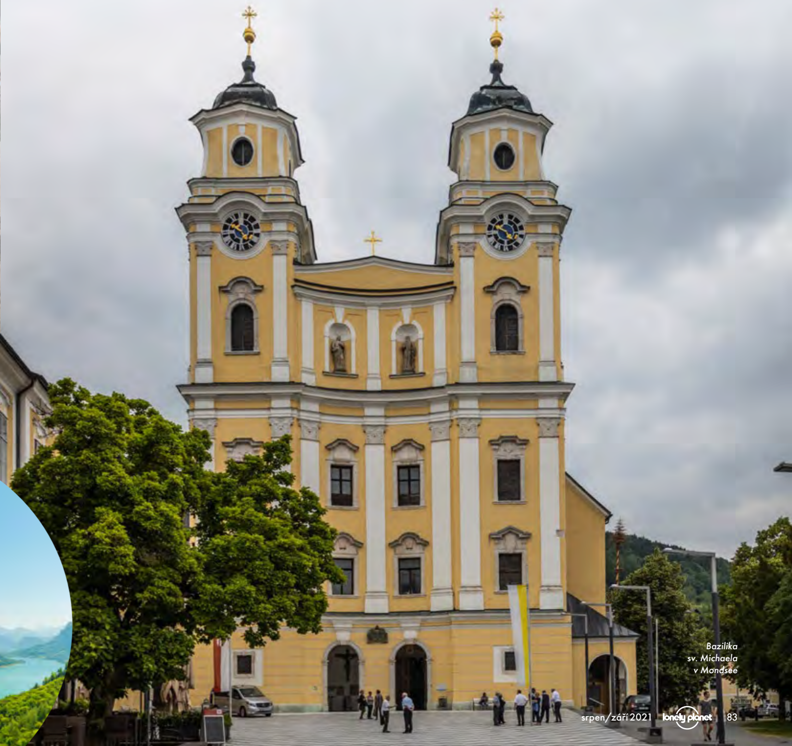
Bazilika sv. Michaela v Mondsee

otevívají pohled do duchovní historie města. Bazilika, která je součástí jednoho z nejstarších benediktinských klášterních komplexů v Evropě, se dnes využívá zejména na kulturní akce. Neproslavila se však jen svou krásou či historií, ale především druhem „turismu“, jímž do Mondsee každoročně láká tisíce návštěvníků z celého světa. Ročně se zde totiž koná kolem 250 svateb, z toho asi 100 přímo v bazilice a zbytek v ostatních klášterních prostorách. Jednu sobotu tak můžete před bazilikou potkat klidně i osm nevěst... Rakousko možná není v našem pojetí zapsáno jako nejromantičtější země Evropy, ale pokud partnerku požádáte o ruku třeba na idylické plavbě na Zille na Halštatském jezeře (jak už to dle slov převozníka udělalo mnoho mladých mužů), samotnou svatbu si pak můžete užít jen o pár kilometrů dál, u dalšího romantického jezera, kde se svatební agentury předhánají v tom, jakou svatbu vám připraví. ➡