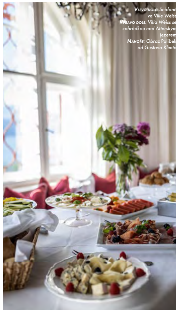
VLEVO DOLE: Snídaně ve Ville Weiss VPRAVO DOLE: Villa Weiss se zahradkou nad Atterským jezerem NAHOŘE: Obraz Polibek od Gustava Klimta

Oblast Attersee byla navíc v dubnu tohoto roku vyhlášena za rezervaci tmavé oblohy , což znamená, že na pozorování hvězdné oblohy jsou zde jedny z nejlepších podmínek v celé Evropě ( naturpark-attersee-traunsee.at ).