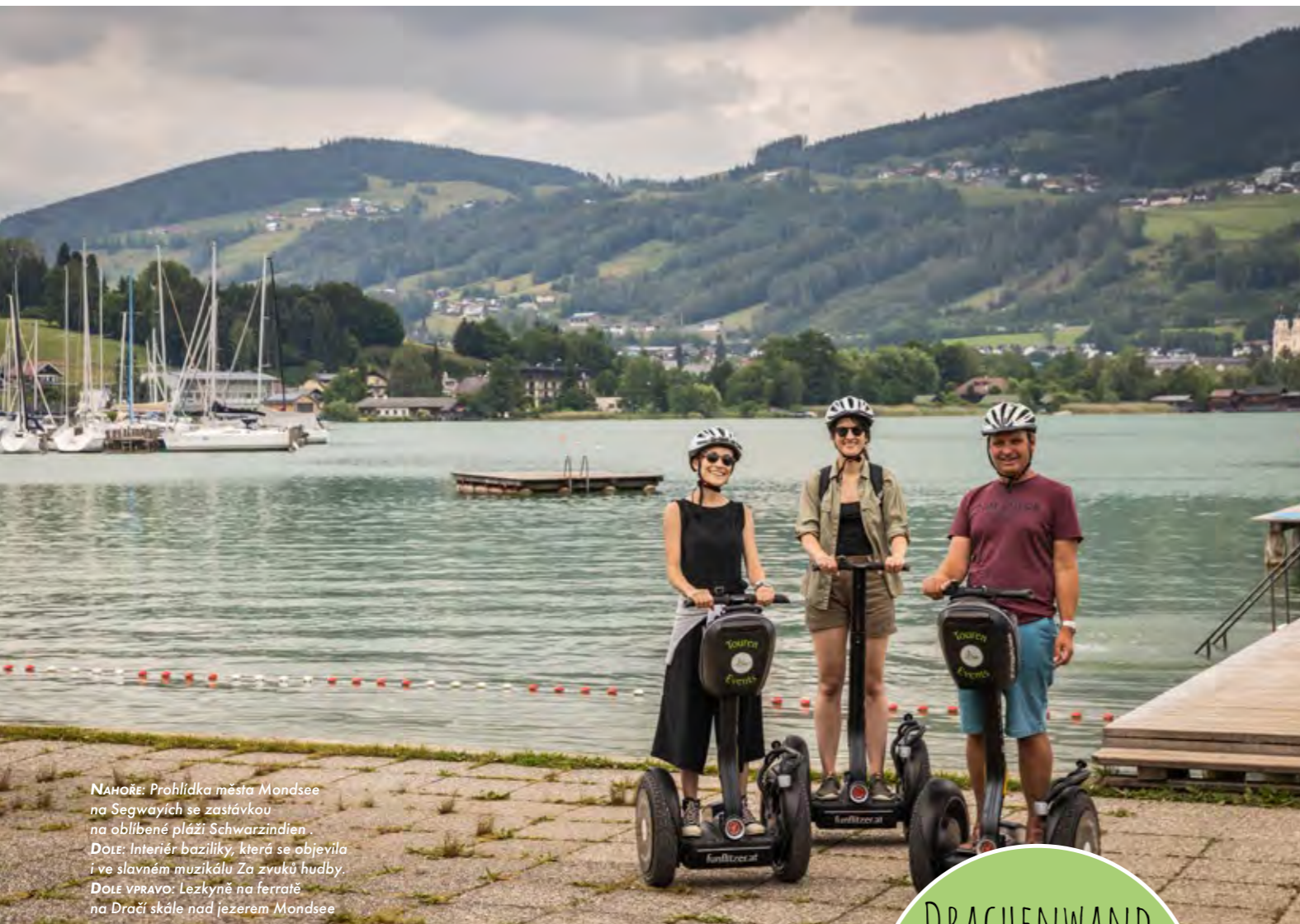
NAHOŘE: Prohlídka města Mondsee na Segwayích se zastávkou na oblíbené pláži Schwarzindien. DOLE: Interiér baziliky, která se objevila i ve slavném muzikálu Za zvuků hudby. DOLE VPRAVO: Lezkyňě na ferratě na Dračí skále nad jezerem Mondsee