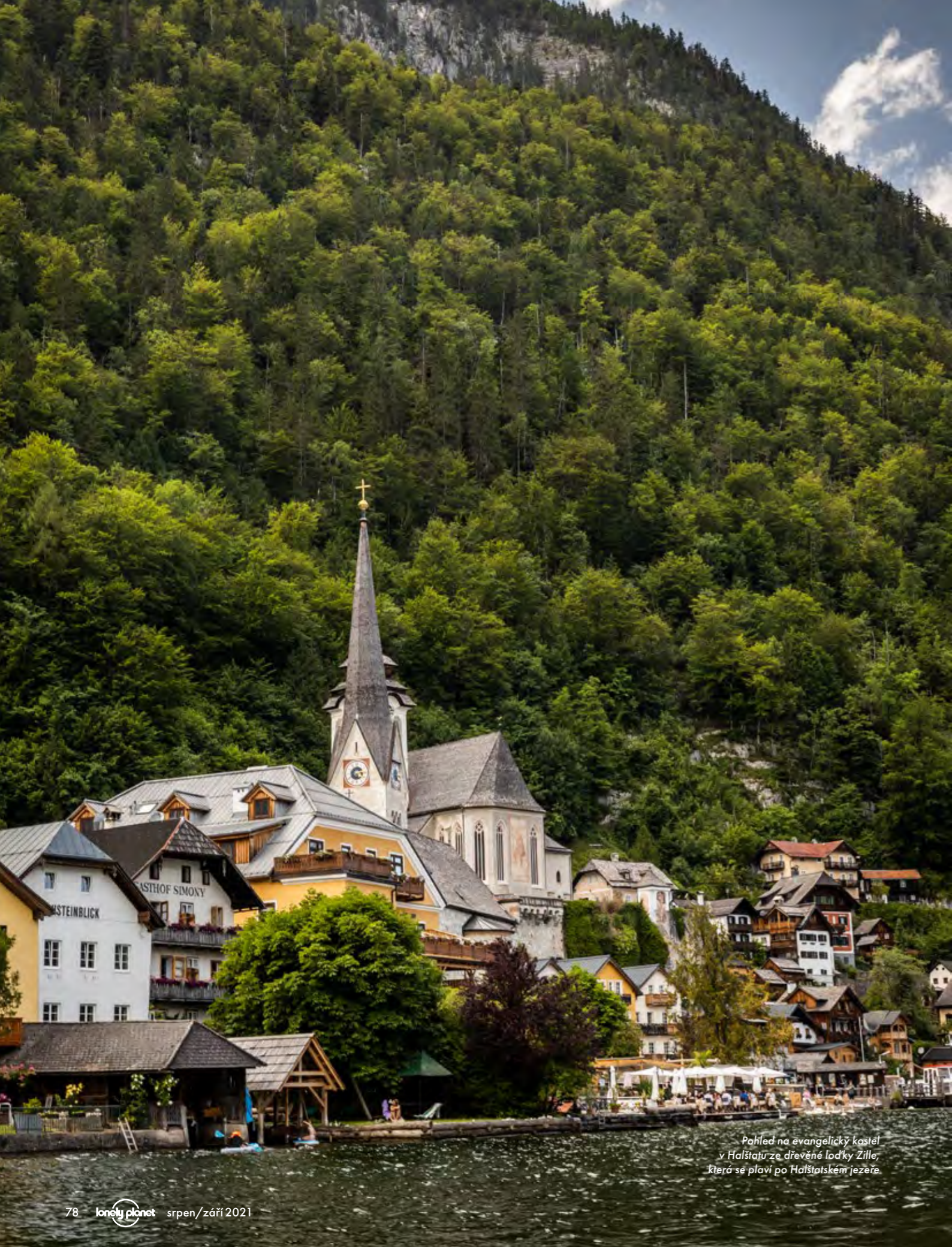
Pohled na evangelický kostel v Halštátu ze dřevěné loďky Zille, která se plaví po Halštátském jezeře.